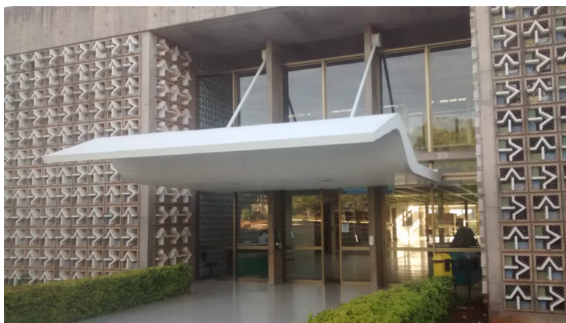
Foto 2.1a. Entrada principal do IQ.

O acesso ao prédio principal do IQ será realizado exclusivamente pela entrada principal (Foto 2.1a), voltada para o estacionamento do prédio. Nela, haverá tapete sanitizante para higienização dos calçados e será disponibilizado álcool gel para higienização das mãos. A portaria próxima do almoxarifado poderá ser utilizada apenas em casos excepcionais, como, por exemplo, a descarga de gases criogênicos para a Central Analítica do Instituto.