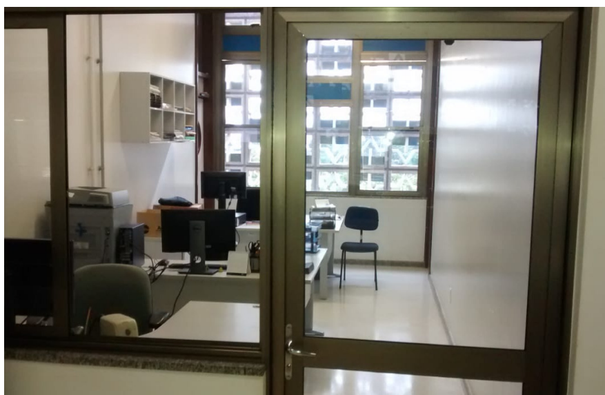
Foto 3.1a. Secretaria Executiva do IQ.