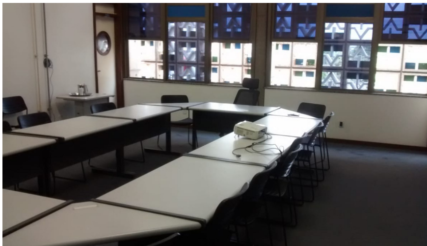
Foto 6.4a. Sala de reuniões da Secretaria do IQ.

boa circulação de ar). Reuniões como as do Conselho e dos Colegiados de Graduação e Pós-Graduação devem continuar sendo realizadas por via remota. Quando utilizadas, as salas de reuniões da secretaria e da DEQ devem permanecer com janelas e portas abertas, a ocupação não deve exceder 1/3 da capacidade do local, os espaços a serem ocupados deverão ser demarcados de forma a maximizar o distanciamento entre os ocupantes e as reuniões não devem se prolongar por mais de 1 h.