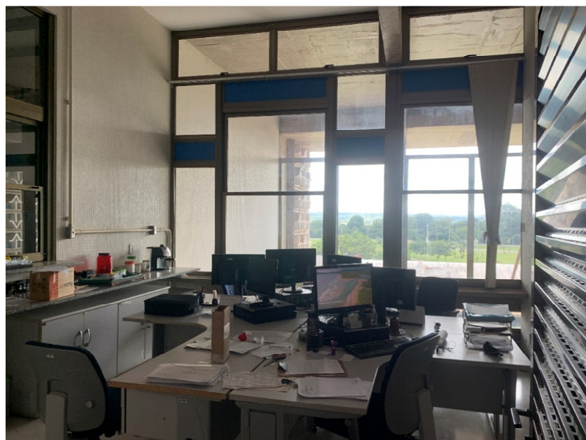
Foto 3.2a. Secretaria Administrativa do IQ.