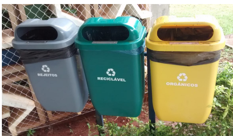
Fotos 2.2a. Lixeiras localizadas na portaria do IQ.

O bebedouro do IQ, que se localiza no andar térreo, possui funcionamento por sensor, de forma que os usuários não precisam tocá-lo para o acionamento. Lixeiras em ótimas condições e que não necessitam ser tocadas para a disposição do lixo podem ser encontradas na entrada e por todo o prédio do IQ.