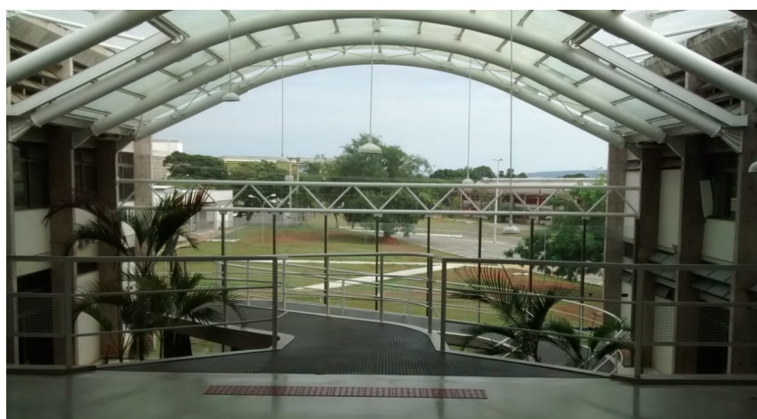
Fotos 1.2a e 1.2b. Interior do prédio do IQ.