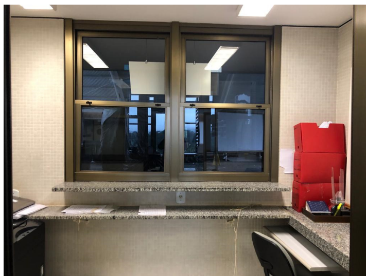
Fotos 3.4.a, 3.4b e 3.4c. Secretaria de Pós-Graduação do IQ.