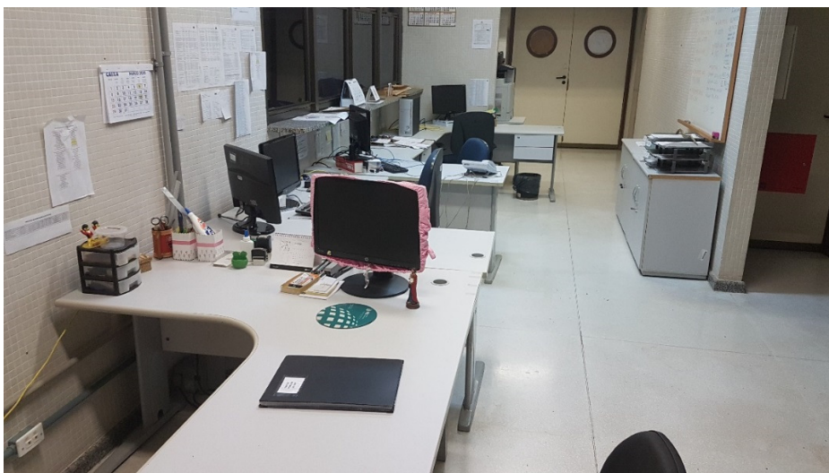
Fotos 3.3a, 3.3b e 3.3c. Secretaria de Graduação do IQ.