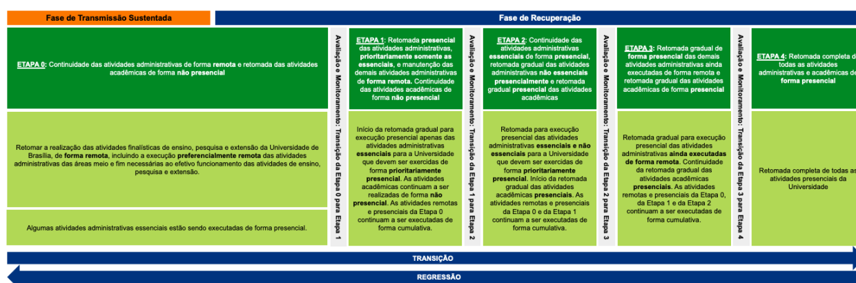
Figura 1. Fases do Plano de Contingência da UnB.

Abaixo são apresentadas as diretrizes que balizam a progressão ou retrocesso para as etapas de recuperação ( Figura 1 ). Convém destacar que no momento a Universidade de Brasília iniciará a Etapa 2 de Recuperação.